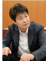
おおたまさかつ 太田昌克さんプロフィール

1968年富山県生まれ。ジャーナリスト、共同通信社編集委員(論説委員兼務)。早稲田大学客員教授、長崎大学客員教授。博士(政策研究)。共同通信社広島支局、外信部、政治部、ワシントン支局などを経て現職。2006年度ボーン・上田記念国際記者賞、2009年度平和・協同ジャーナリスト基金賞(大賞)を受賞。主著に『日米<核>同盟』(岩波新書)『偽装の被爆国』(岩波書店)。テレビ朝日「ワイド!スクランブル」でレギュラーコメンテーター(火曜)を務めるほか、テレビ朝日「羽鳥慎一モーニングショー」、TBS「サンデーモーニング」などにコメンテーターとして出演。