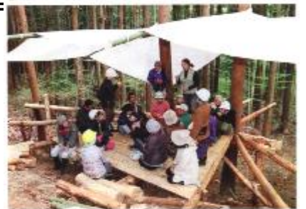
反対派市民が森カフェ作り