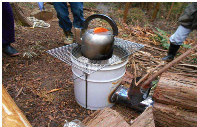
ロケットストーブでいれたおいしいコーヒーです