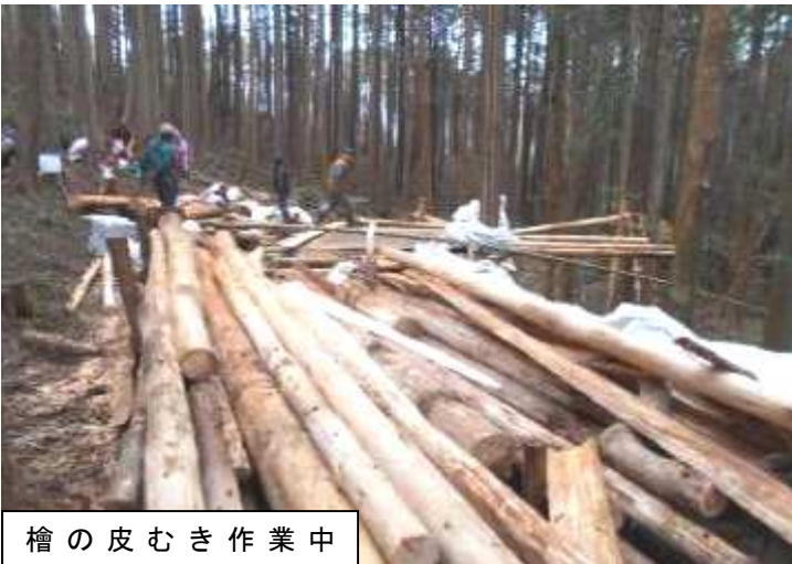
檜の皮むき作業中