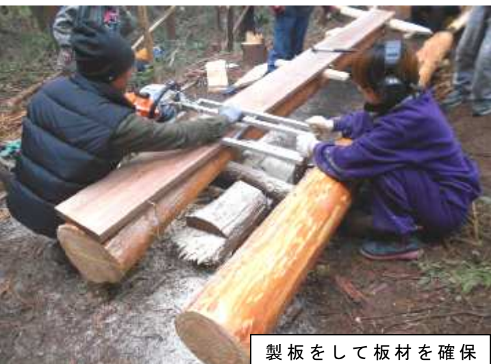
製板をして板材を確保