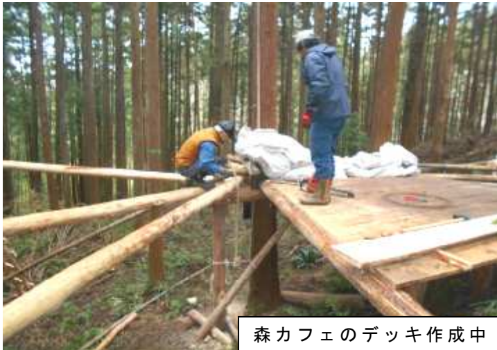
森カフェのデッキ作成中

リニア新幹線相模原連絡会では、リニア関東車両基地の建設予定地である鳥屋地区の車両基地建設予定地に、トラスト地権者さんの協力を得て「森カフェ」を作る運動を進めています。10月13日の鳥屋の測量調査説明会ではトラスト地11人の地権者はJR東海に対し測量のための立ち入りを断固拒否する旨、書面で提出しました。