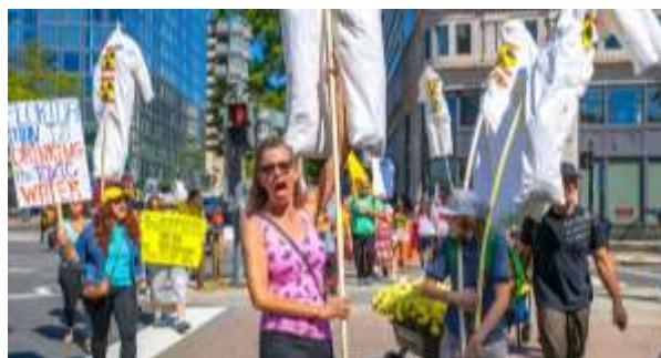
ワシントンで規制強化を要求する市民運動

自然界で分解されないことで「永遠の化学物質」といわれる PFAS(有機フッ素化合物)。発がん性が疑われる PFAS 汚染は全国に広がり、市民に不安をもたらしています。PFAS 汚染の人体への影響や広がりを明らかにし、対応する市民運動の紹介、そしてその課題と対策をお話しします。