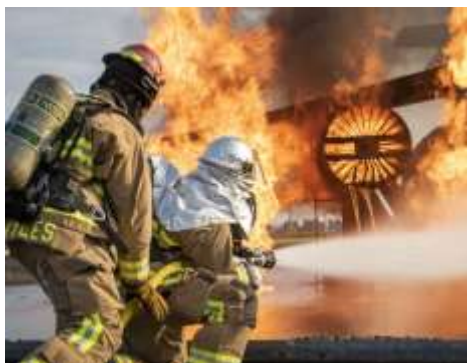
米空軍演習として実施された消火訓練

自然界で分解されないことで「永遠の化学物質」といわれる PFAS(有機フッ素化合物)。発がん性が疑われる PFAS 汚染は全国に広がり、市民に不安をもたらしています。PFAS 汚染の人体への影響や広がりを明らかにし、対応する市民運動の紹介、そしてその課題と対策をお話しします。